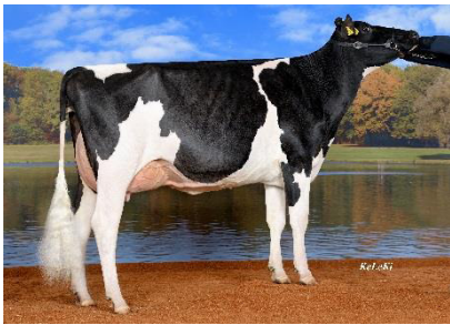
BcH Ellen, 1. LA Rinderzucht Augustin KG, Neuendorf

SUKARI AMS – Auch der Supersire-Sohn Sukari hält seine Zuchtwerte konstant. Er steht für Kühe mit mittlerem Rahmen und festen Eutern. Die optimale Strichplatzierung in Kombination mit der Strichlänge gewährleisten einen Einsatz am automatischen Melksystem ( RZRobot 115 ) und unterstreichen seine Funktionalität . Die RZGesund-Werte sind durchweg positiv und lassen eine lange Nutzungsdauer (121) erwarten.