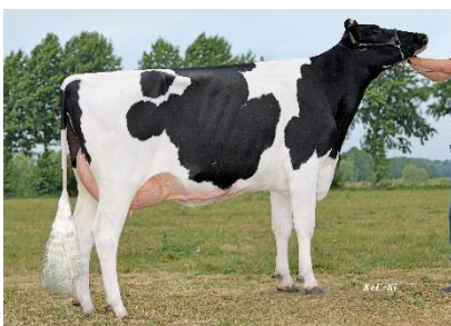
Phillipa, 1. LA Agr. Prod. Lindstedt e.G.

PHOENIX – Der Newcomer stammt aus der Familie von Snow-N Denises Dellia EX95. Phoenix-Töchter sind ihren Stallgefährtinnen in der Milch- (+1.670 Mkg) und Fett-Eiweiß-Leistung (+106 FEK) weit überlegen. Die milchtypischen, kräftigen, tiefen Tiere mit breiten, stärker geneigten Becken und optimal gewinkelten Beinen fallen bereits als Jungrinder in den Betrieben auf. Nicht für Färsenbesamungen geeignet.