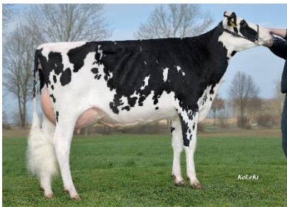
TD Dörte, 1. LA, Tantzen/ Dobbehaus GbR, Wakenstädt

DREAMSHOT AMS – der Spross aus der Dynastie von Outside Dabble EX91 glänzt in sämtlichen Bereichen: Leistung (+1.503 Mkg), Exterieur (127) und Gesundheit – eben ein echter Allrounder! Seine Töchter spiegeln dies in den Ställen wider und zeigen sich mit kleinerem Rahmen (89) und viel Praxistauglichkeit . 460 weitere Tiere stabilisieren dabei seine Zuchtwerte und führten zu einem Plus von 273 Mkg. Gesext verfügbar.