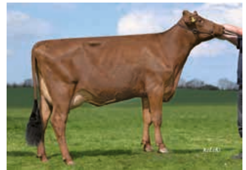
Zanra (1) GP 83, Jürgensen Roikier GbR,Quern

10.586158 DE 01 22771388 BB geb.: 06.08.2017