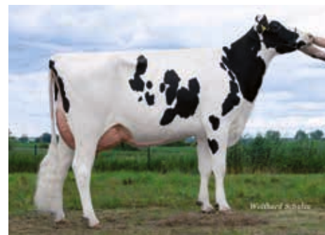
BGW Garida (2) VG 86, BG Ziltendorfer Niederung GbR, Wiesenau

DE 01 22629481 aAa 315426 geb.: 24.08.2017