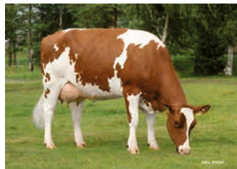
Vanille (1) GP 84, Karstens,Tensbüttel-Röst