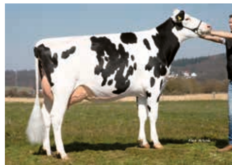
Osiris, Schweinsberger/Dersch GbR, Niederwald

DE 05 39536462 aAa 243615 geb.: 02.03.2017