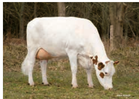
Witzbold (1) GP 84, Rathjen-Fechter,Hamdorf