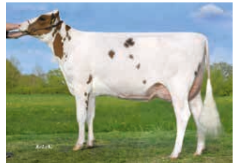
Dreamgirl VG-85, Margret Beerbaum, Saerbeck

10.917617 NL 576852597 aAa 423516 BB geb.: 03.01.2018