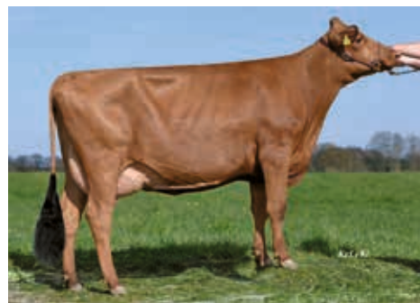
Stall-Nr. 202 (1) GP 84, Thomsen, Gruenholz