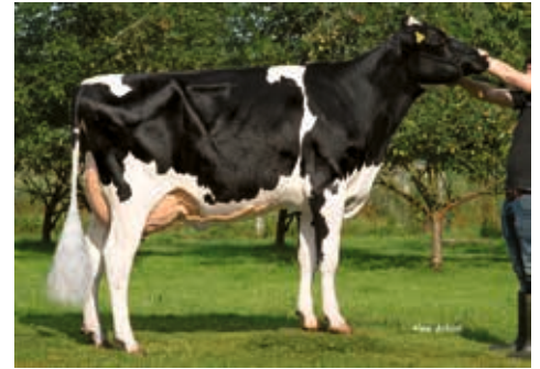
Wisconsin (1) GP 84, Markus Kühl, Wasbek

[ Beacon RUW Study 122 (1) VG 87 v. Billion 3