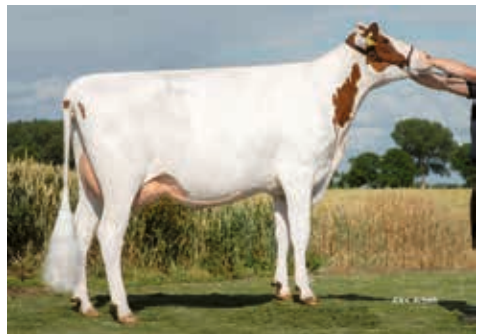
Zecke (1) VG 84, Magens, Kollmar

NL 687404238 aAa 432516 A2A2 geb.: 13.11.2017