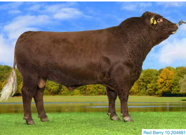
Red Berry 10.204681