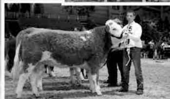
Bundesreservesiegerin Berlin 2016

In der Besamung setzen wir nationale und internationale Spitzenvererber ein! Aus unserer 100- köpfigen Zuchtherde bieten wir ganzjährig Jungbullen und Zuchtrinder zum Verkauf an.