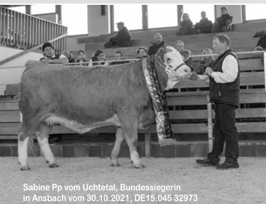
Sabine Pp vom Uchtetal, Bundessiegerin in Ansbach vom 30.10.2021, DE15.045 32973

Käthen · Käthener Str. 18 · 39628 Bismark Tel. +49 39325 21267 · Fax +49 39325 22370 Mobil +49 170 7647012 E-Mail: feissel@gmx.net