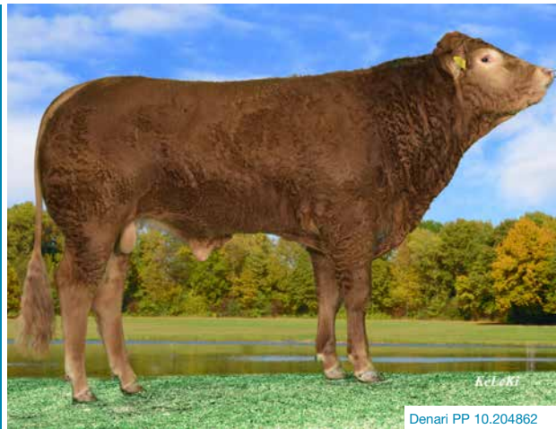
Denari PP 10.204862

Beste Genetik für den Einsatz in Reinzucht!