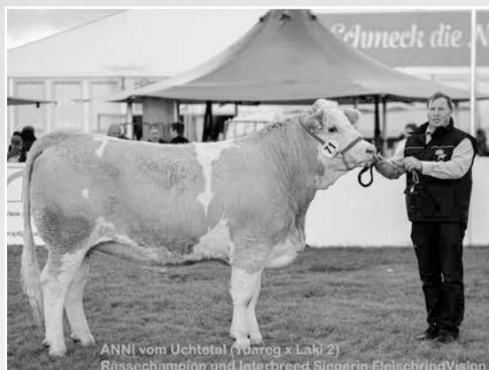
ANNI vom Uchtetal (Hüdeg x Laki 2) Rassechampion und Interbreed Siegerin FleischrindVision