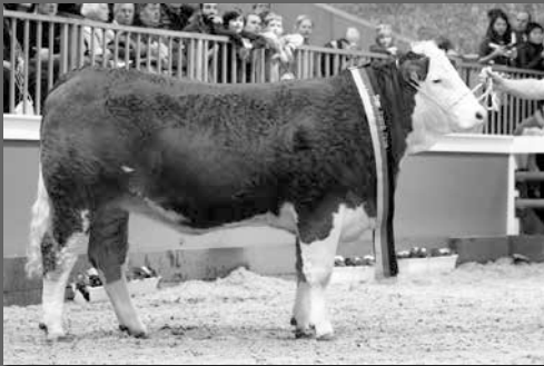
UHA Pandora · Grand Champion Berlin 2016

Unser Verkaufsangebot bei der Auktion am 28.2.2023