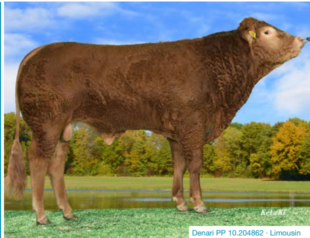
Denari PP 10.204862 · Limousin

Beste Genetik für den Einsatz in Reinzucht!