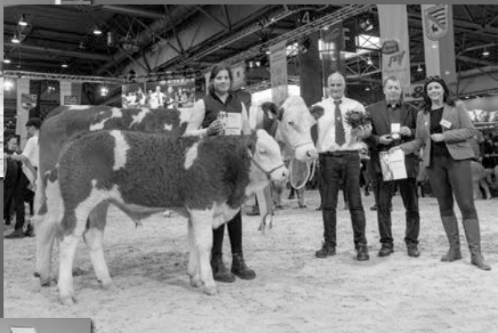
UHA Polly Gesamtsieger Kuhklassen agra 2022, Bundessieger Erfurt 2018