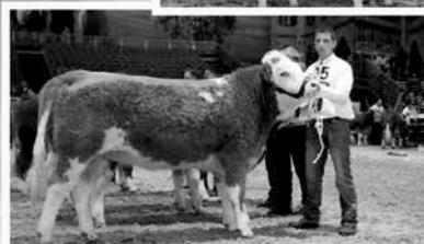
Bundesreservesiegerin Berlin 2016

In der Besamung setzen wir nationale und internationale Spitzenvererber ein!