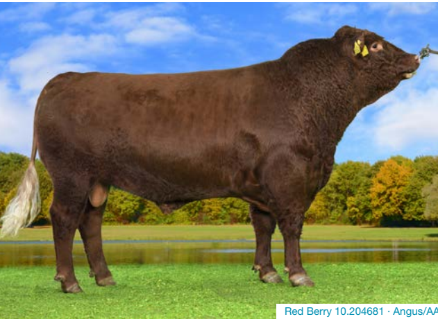
Red Berry 10.204681 · Angus/AA