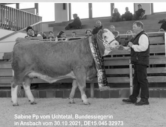
Sabine Pp vom Uchtetal, Bundessiegerin in Ansbach vom 30.10.2021, DE15.045 32973

Käthen · Käthener Str. 18 · 39628 Bismark Tel. +49 39325 21267 · Fax +49 39325 22370 Mobil +49 170 7647012 E-Mail: feissel@gmx.net