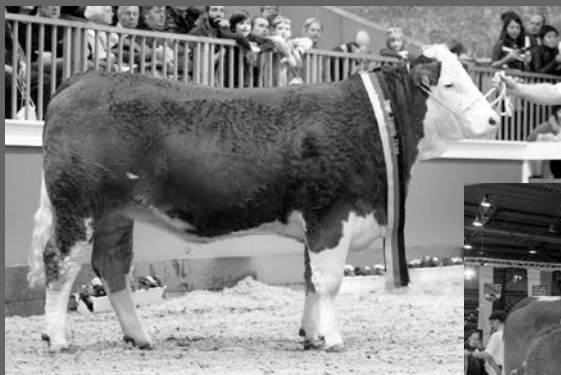
UHA Pandora Grand Champion Berlin 2016