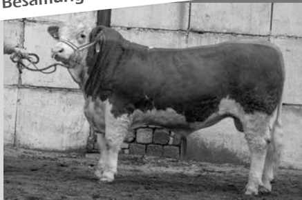
Mika Pp 603344

Die Auswahl unserer Herdenbullen – seit Jahren ein Garant für höchste Qualität