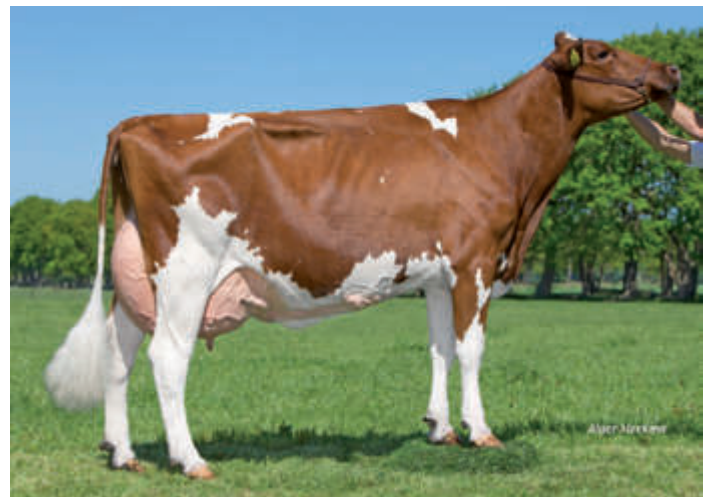
MM: Red Rocks Massia 128 (2) VG 86, Niederlande