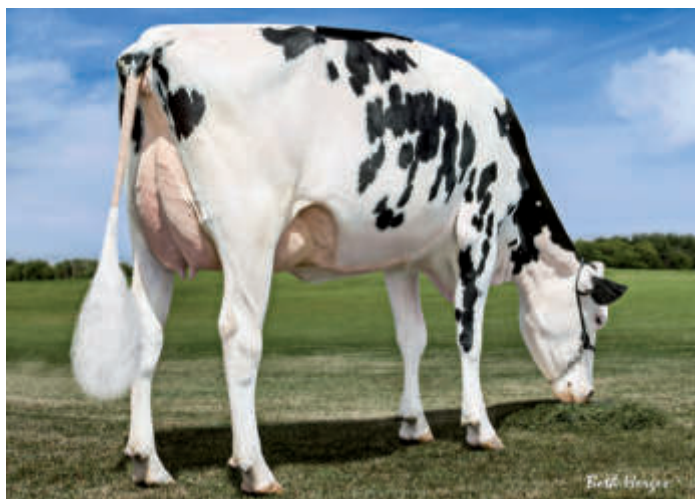
6. M: MS C-Haven Oman Kool-ET (2) VG 88, USA