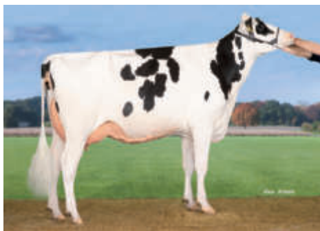
Sydney VG 86, LWB Gropp GbR, Klockow

DE 15 044 01583 geb.: 06.07.2017 aAa 432156 A2A2