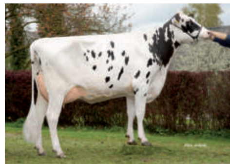
Ava (1) GP 84, Wendell GbR, Beringstedt

DE 07 70655539 geb.: 28.06.2018 aAa 243165 ET