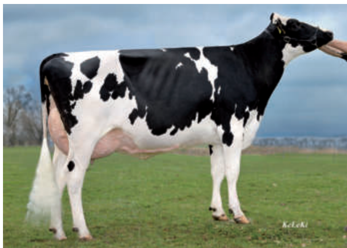
RZA Selma VG 85, ADAP RZ GmbH Ahrenshagen