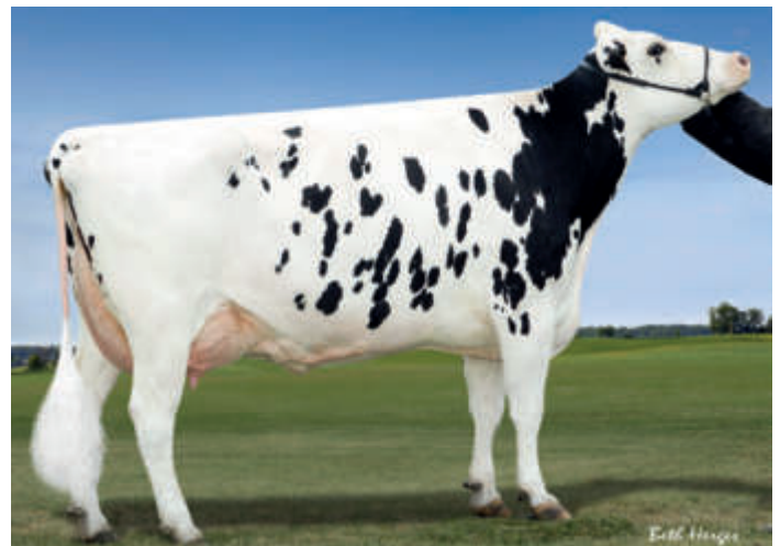
6. M: De-Su 7012 (2) EX 92, Ausland, USA