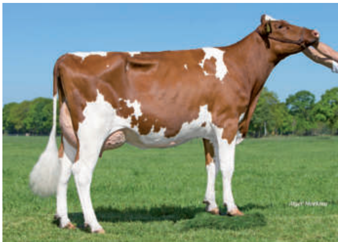
M: Red Rocks Massia 155 VG 86, Niederlande