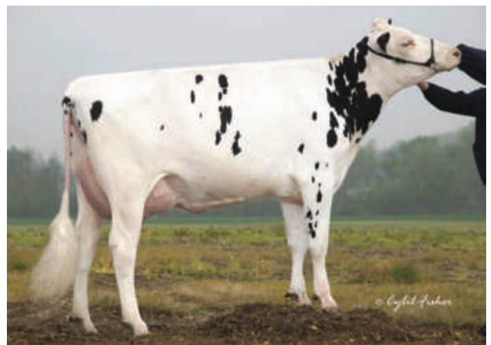
7. M: Art-Acres Shottle Kay721 (3) EX 90, USA