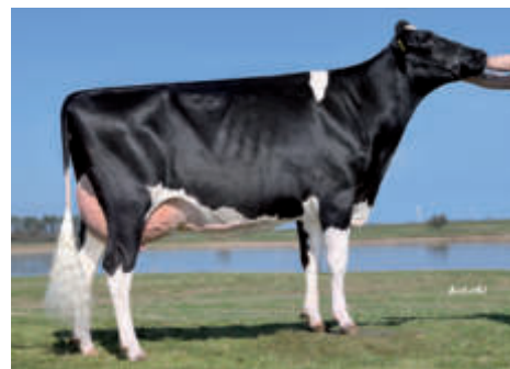
Betty (3) VG 89, 3. LA, Agrarhof Busse-Paucke GbR, Schelldorf

DK 05609302452 geb.: 07.01.2015 aAa 432516 A2A2, BB