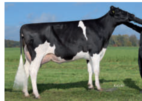
Gundula, Kastanienhof Rave KG, Schlieven

DE 15 043 36100 geb.: 02.04.2018 aAa 342516 BB ET