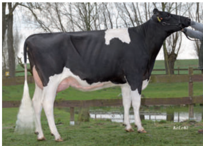
MPG Gisele VG 85, Rainer u. Chr. Mann GbR, Steinbeck