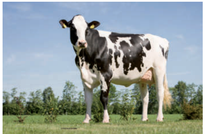
MM: Chantre, Hermann u. Jörg Ekkel GbR, Itterbeck