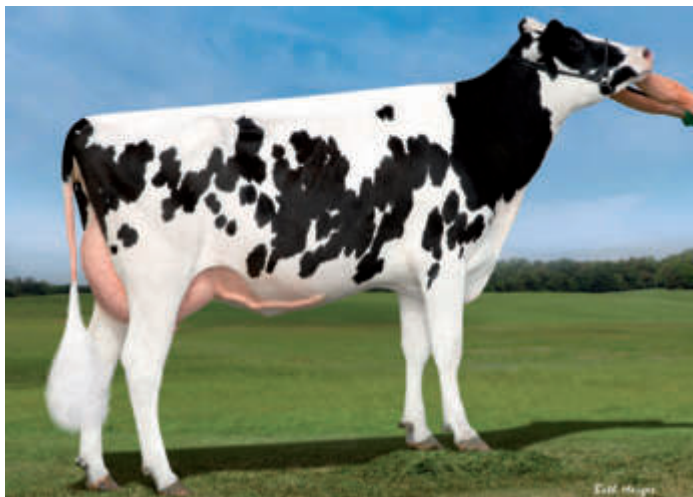
4. M: S-S-I Moonry Myesha 9071-ET VG 85, Ausland, USA