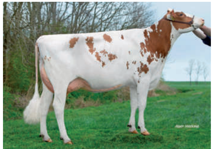
MM: Koepon Slvtr Sanne 8 VG 88, W N Pon-Koepon, NL