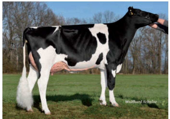
Okapi (3) EX 90, Agrar GmbH Auligk, Gatzten