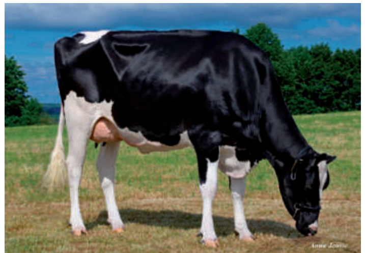
MM: SHS England (2) VG 87, Thomas Schäfer, Steiningen