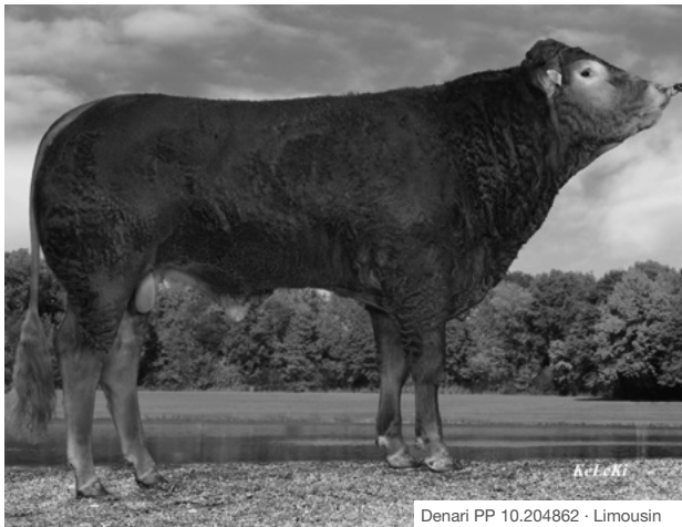
Denari PP 10.204862 · Limousin

Beste Genetik für den Einsatz in Reinzucht!