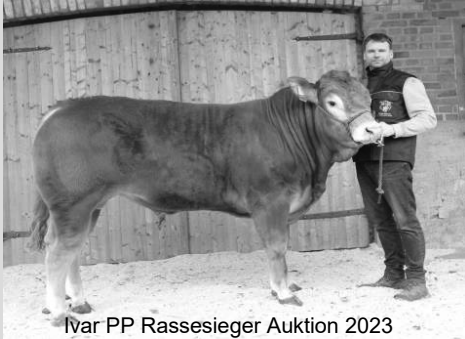
Ivar PP Rassesieger Auktion 2023