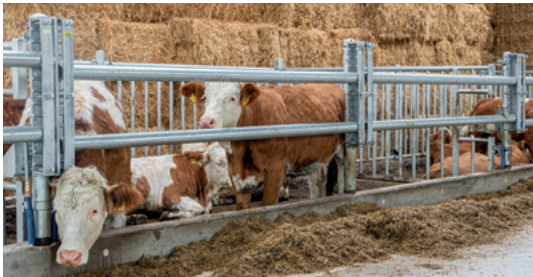
Futtertischabtrennung für Bullen