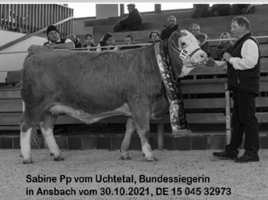
Sabine Pp vom Uchtetal, Bundessiegerin in Ansbach vom 30.10.2021, DE 15 045 32973

Käthen · Käthener Str. 18 · 39628 Bismark · Tel. +49 39325 21267 · Fax +49 39325 22370 Mobil +49 170 7647012 · E-Mail: feissel@gmx.net