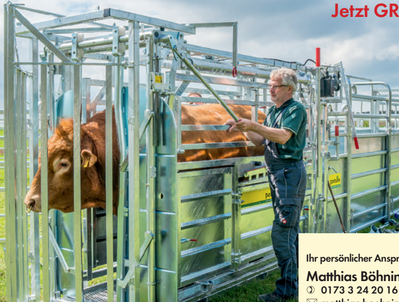
Behandlungsanlagen, Weidetore, Panels