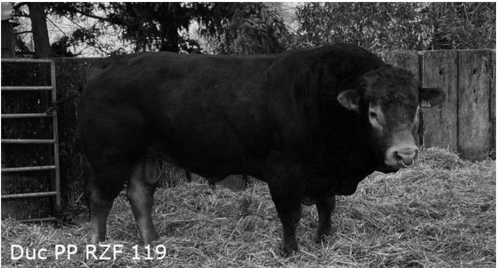
Duc PP RZF 119