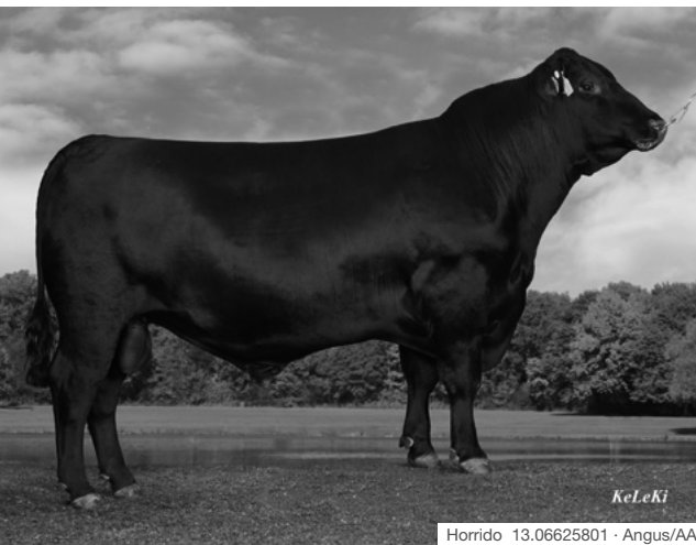
Horrido 13.06625801 · Angus/AA