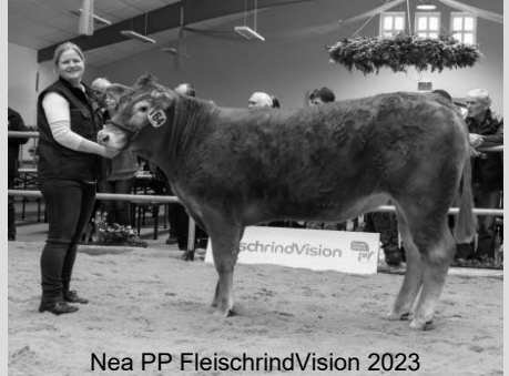
Nea PP FleischrindVision 2023