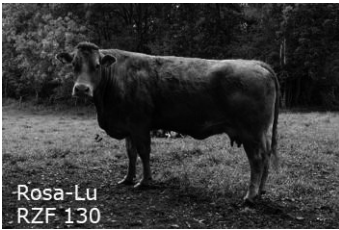
Rosa-Lu RZF 130