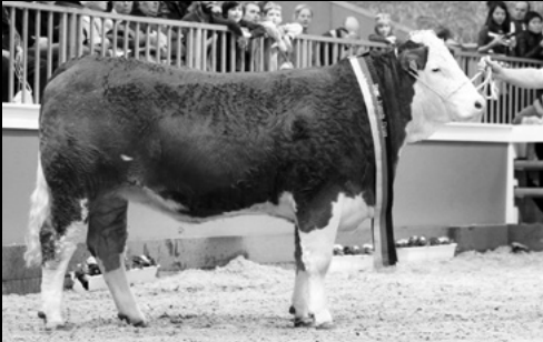
UHA Pandora · Grand Champion Berlin 2016