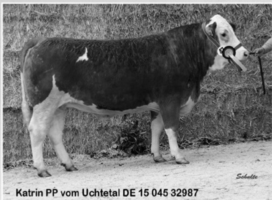
Katrin PP vom Uchtetal DE 15 045 32987