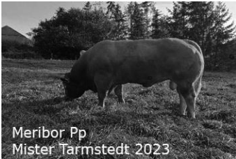
Meribor Pp Mister Tarmstedt 2023