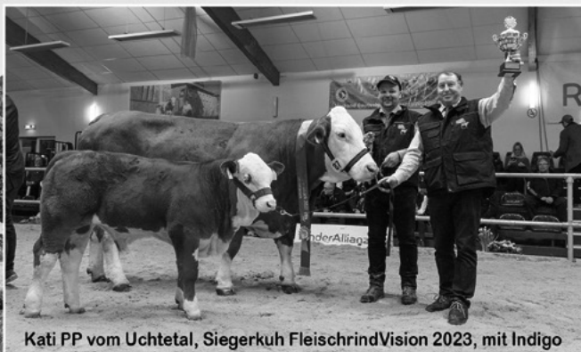
Kati PP vom Uchtetal, Siegerkuh FleischrindVision 2023, mit Indigo

Ausgesuchte Zuchttiere stehen ganzjährig zum Verkauf.